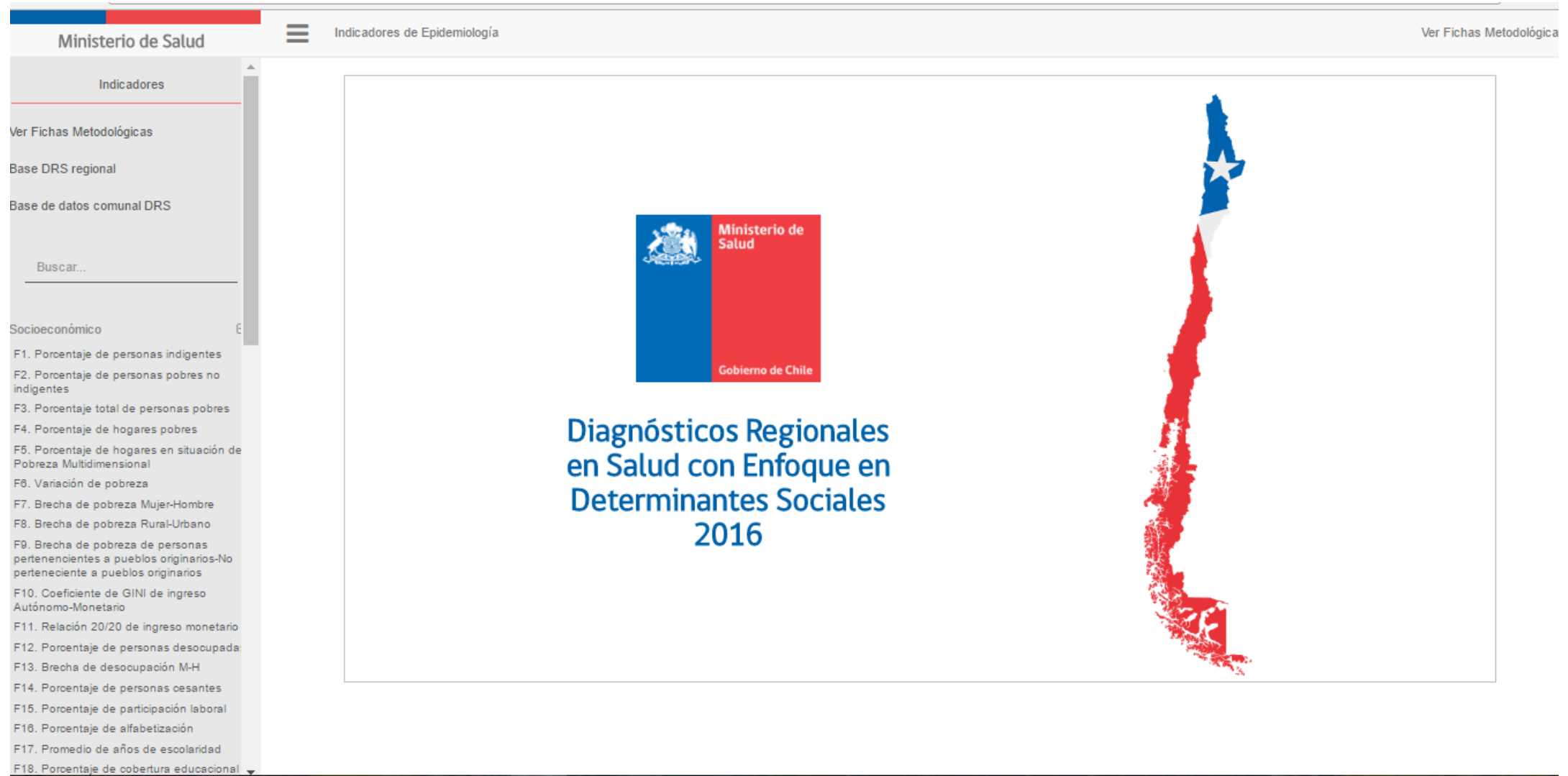
Tableau DRS: Difusión inmediata y dinámica