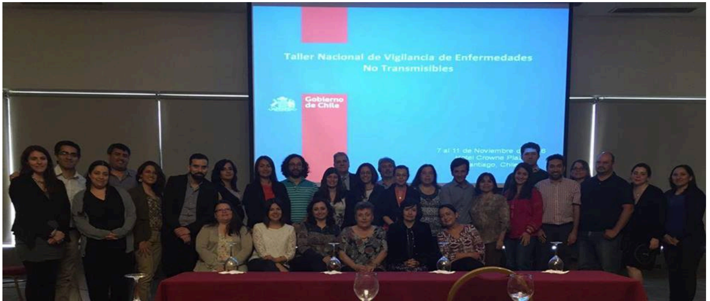
Taller Nacional de Vigilancia de Enfermedades no Transmisibles y DRS Noviembre 2016